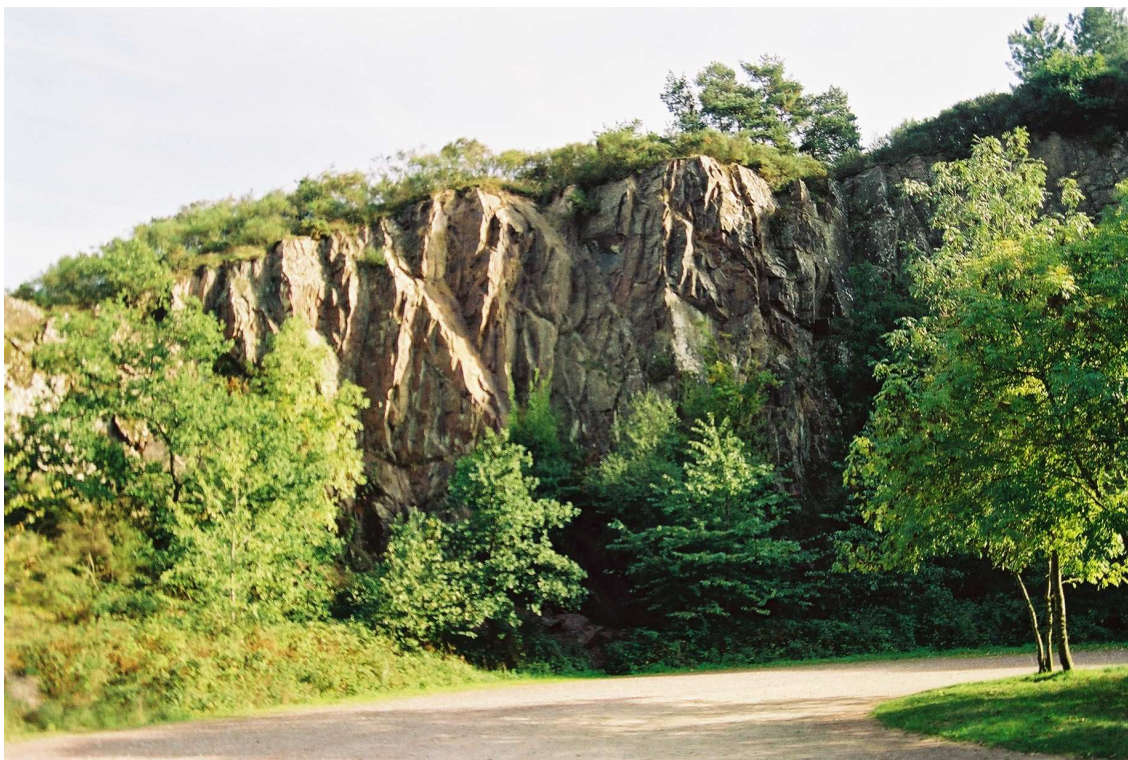
l'ancienne carrière à l'entrée du site